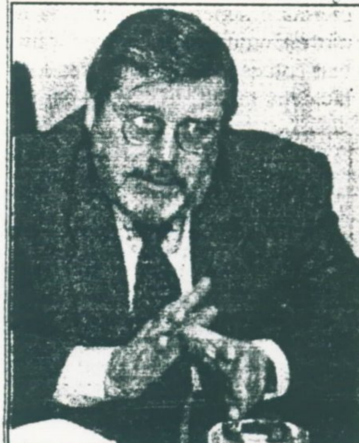
Capuano: centro atrairá imóveis de médio e baixo padrão

também deve, após a reurbanização, atrair empresas médias e pequenas", vaticina Capuano.